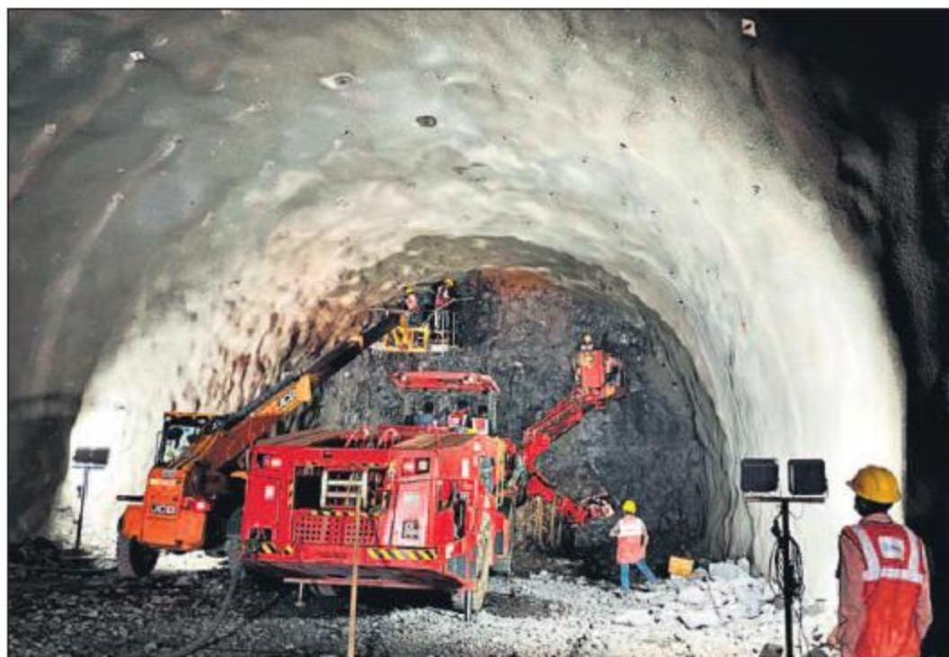
A total of 214 controlled blasts were carried out using 27,515 kg of explosives for the tunnel excavation.