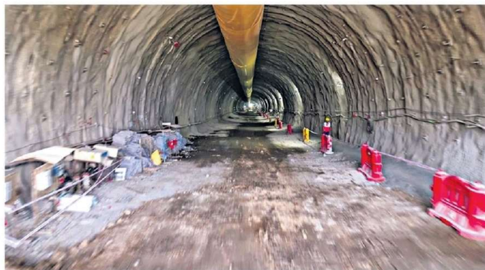
The 394-m-long intermediate tunnel, which has been excavated for the Mumbai-Ahmedabad Bullet Train Project, in Mumbai.