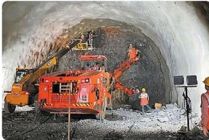
घनसोली में 394 मीटर लंबी सुरंग।

सुरत. मुंबई-अहमदाबाद बुलेट ट्रेन परियोजना में महाराष्ट्र घनसोली में 394 मीटर लंबी अतिरिक्त संचालित मध्यवर्ती सुरंग (एडीआईटी) की सफलतापूर्वक खुदाई की गई है। यह उपलब्धि महाराष्ट्र में बांद्रा-कुर्ला कॉम्प्लेक्स (बीकेसी) और शिलफाटा को जोड़ने वाली 21 किलोमीटर लंबी सुरंग के निर्माण में तेजी लाने की दिशा में एक महत्वपूर्ण कदम है। नेशनल हाई-स्पीड रेल कॉर्पोरेशन (एनएचएसआरसीएल) की ओर से बताया कि 26 मीटर की गहराई इनक्लाइंड एडीआईटी न्यू ऑस्ट्रियन टनलिंग मेथड